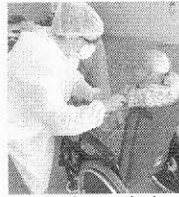
Idosos foram vacinados nesta semana