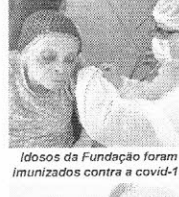
Idosos da Fundação foram imunizados contra a covid-19