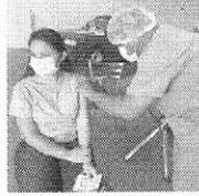
Funcionários da Reviver também foram imunizados